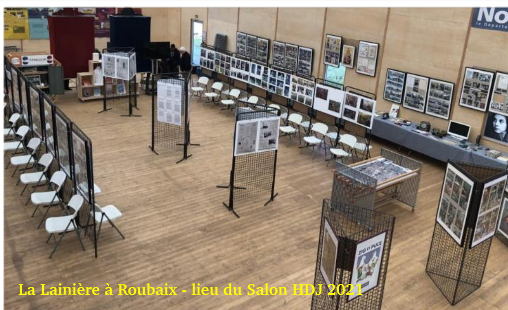
La Lainière à Roubaix - lieu du Salon HDJ 2021

Invitation à participer au projet franco-wallon